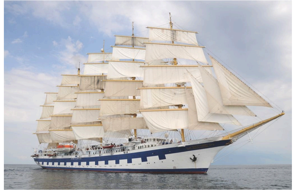
Un clipper, comme 'Le Mineiro' de notre titre dunkerquois.

Chanson à ramer bretonne, évoquant la disparition d'un marin dans une tempête.